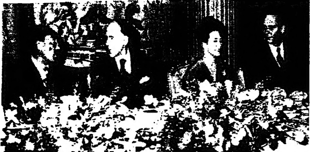
السيدات السادات وعقيدته والرئيس جيسكار ديستان وجيك شيراك رئيس الحكومة الفرنسية أثناء مأدبة الأعياد مساء أمس الأول